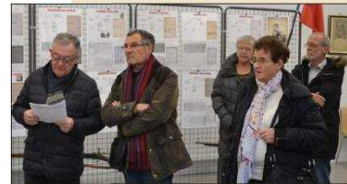
■ Le remarquable travail de compilation des anciens combattants a été salué par les élus.

Jusqu'au 10 décembre, la salle Pingré accueille une exposition conjointe de l'Association des anciens combattants de la Résistance (ANACR) et de l'Union nationales combattants (UNC) sur la Première Guerre mondiale. Les membres des deux associations ont choisi de se concentrer sur l'année 1917 avec deux volets. Tout d'abord, la bataille du Chemin des Dames qui en deux mois a fait 200 000 morts du côté français et 300 000 du côté allemand. Le deuxième volet comporte la rétrospective des morts de Bourbon-Lancy en cette année 1917, comme cela avait été fait pour les autres années.