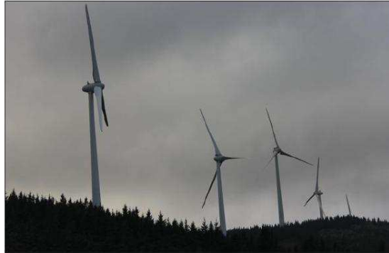
■ L'extension du parc éolien de Lentefaye à Grury, n'est pas remise en cause. Toutefois, Global Wind Power traite actuellement d'autres priorités.

L'étude de faisabilité est toujours en cours. Sur place, des proprié-